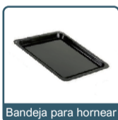
Bandeja para hornear