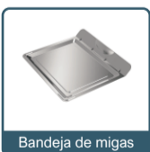
Bandeja de migas