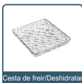
Cesta de freír/Deshidratar