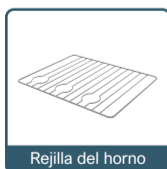
Rejilla del horno