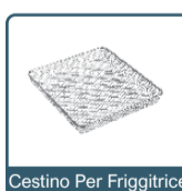
Cestino Per Friggitrice